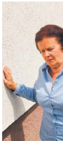
(Abbildung Betroffenen nachempfunden)

Das Ergebnis: Die Schwindelbeschwerden können effektiv bekämpft werden.